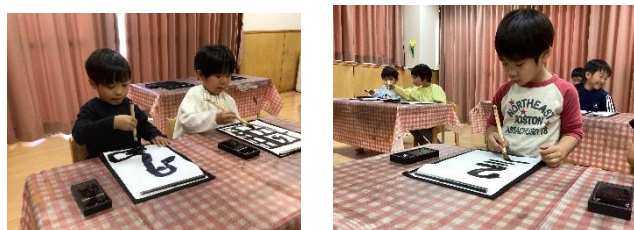
道組 初めての書道の様子 真剣な表情、正しい姿勢で取り組んでいます