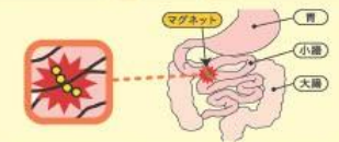
▲複数のマグネットが腸管を挟み込んだ状態