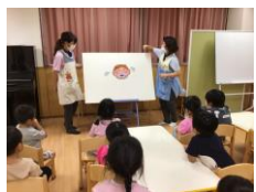
6月 歯磨き指導 パネルシアターの様子 (幼児組)