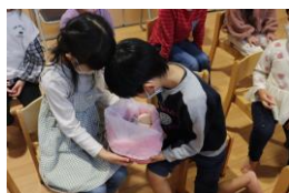
1月 いのちのお話 胎児人形を抱っこ体験 (年長組)